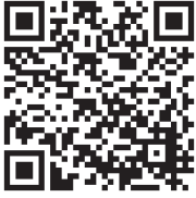
申込フォームQRコード